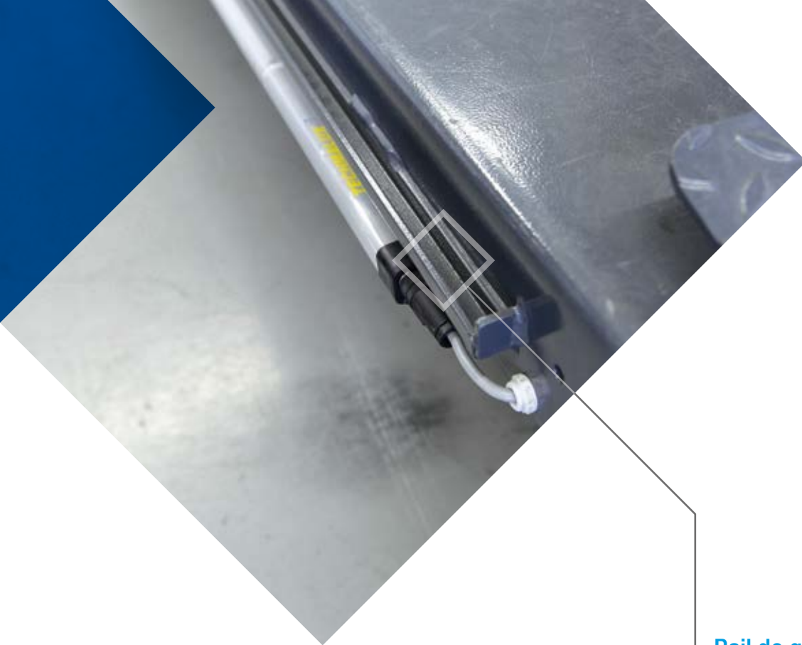
Rail de guidage pour élévateur d'essieux monté sur le chemin de roulement

Dispositif de dépose pour le contrôle de l'alignement des roues en série, à bras en dents de scie à réglage de précision et loquet à actionnement électromagnétique